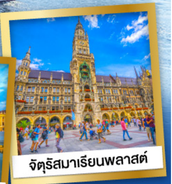
จัตุรัสมาเรียนพลาสต์