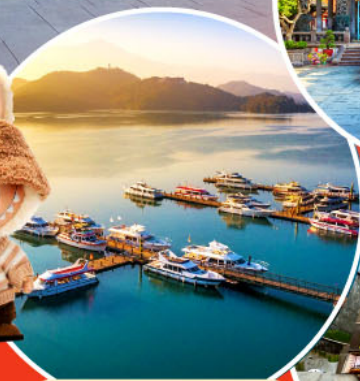
ทะเลสาบสุริยขึ้นจันทรา