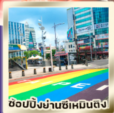
ช้อปปิ้งย่านซีเหมินติง