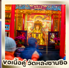
งอนี้่วคู่ วัดหลงซานซือ