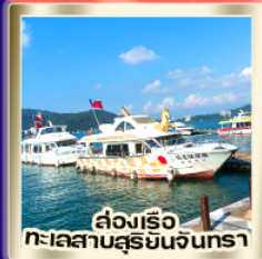
ล่องเรือ ทะเลสาบสุริยจันทร์